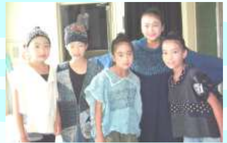
母女ファイナルの舞台より